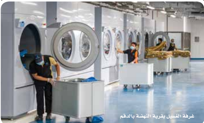
غرفة الغسيل بقرية النهضة بالدمم

التحتية بطريقة منظمة ومتكاملة. وتملك النهضة عقدين من الخبرة حيث قامت بتقديم وتنفيذ العديد من المشاريع في مواقع شركة تنمية نفط عمان والمراق وأفغانستان لصالح القوات الأمريكية، والآن في الدمام. وقد تجاوز حجم ومستوى المشاريع مع مرور الوقت أكثر من ١ مليار دولار من الاستثمارات، وفي كل مناسبة كانت مشاريعنا ضمن حدود التكلفة وفي الوقت المحدد مع تنفيذ ناجح. لقد غير هذا السجل الحافل للشركة بشكل جوهري ملف المخاطر نحو المؤسسات المالية، وقدمنا للمرة الأولى بدعوة مستثمرين مشاركين لمشروعنا الناجح في الدمام وهم شؤون البلاط السلطاني وصندوق تقاعد وزارة الدفاع وبنك مسقط ومجموعة الخنيجي.