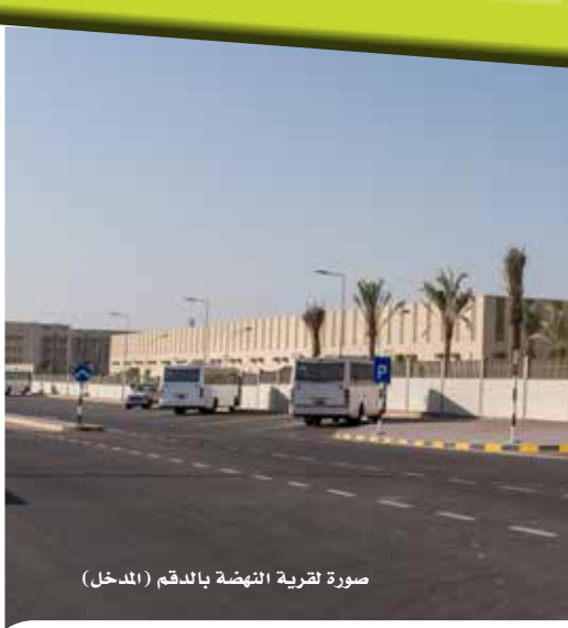
صورة نظرية النهضة بالدمم (المدخل)