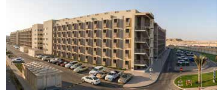
صورة لقرية النهضة بالدمم

هذا ويبلغ إجمالي الاستثمار في المشروع حتى الآن ١٠٠ مليون ريال، مع استثمار إضافي قدره ٣٠ مليون ريال (١٨ مليون دولار أمريكي) في مراحل التوسع الأربع الأخرى. وستُمنح الموافقة على كل مرحلة وفقاً لوضوح مستويات الإشغال المتوقعة.